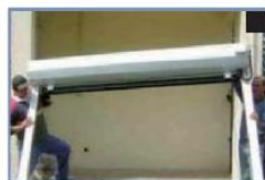
Présentation de la porte devant l'ouverture du garage