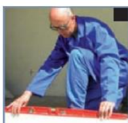
Contrôle de l'horizontalité du sol

Rapidité et simplicité de pose, bonne occultation, manœuvre aisée et surtout robustesse du système font de la porte de garage à enroulement une solution nettement supérieure au principe d'enroulement.