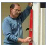
Vérification de l'aplomb des coulisses