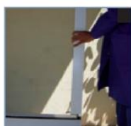
Emboîtement des coulisses dans le coisson