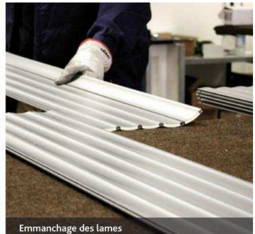
Emmanchage des lames