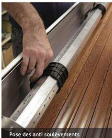
Pose des anti soulèvements