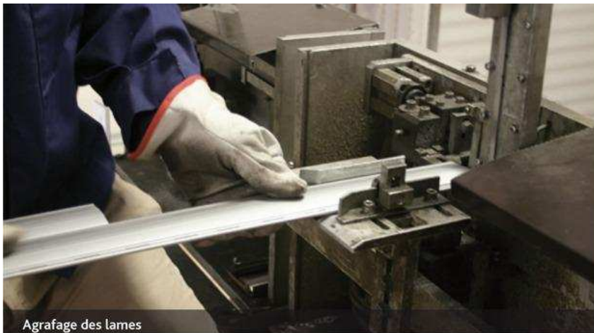
Agrafage des lames

Intégré dès la construction ou appliqué en rénovation, le volet roulant reste une valeur sûre en terme de confort, que sa manœuvre soit manuelle ou électrique. Il supplante les volets battants et demande moins d'entretien.