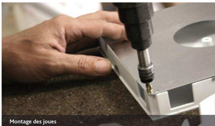
Montage des joues

Chaque volet est l'objet d'un contrôle qualité en fin de fabrication.