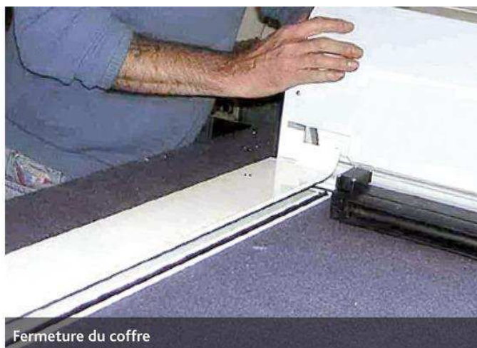
Fermeture du coffre