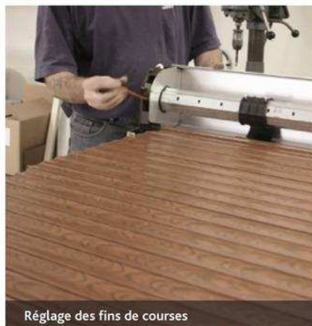
Réglage des fins de courses